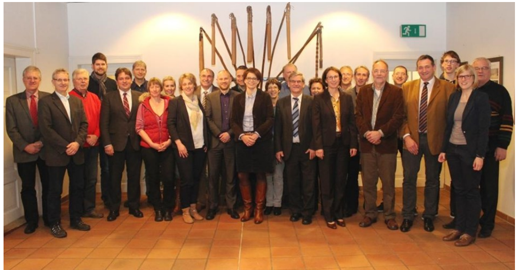
Mitglieder der LAG

Die Aufgaben der LAG sind vielfältig: Sie ist für die Umsetzung der Entwicklungsstrategie zuständig und entscheidet anhand der eingereichten Projektsteckbriefe über die Vergabe der LEADER-Mittel. Sie tagt dreimal im Jahr. Die Sitzungstermine finden Sie unter www.oberes-oertzetal.de